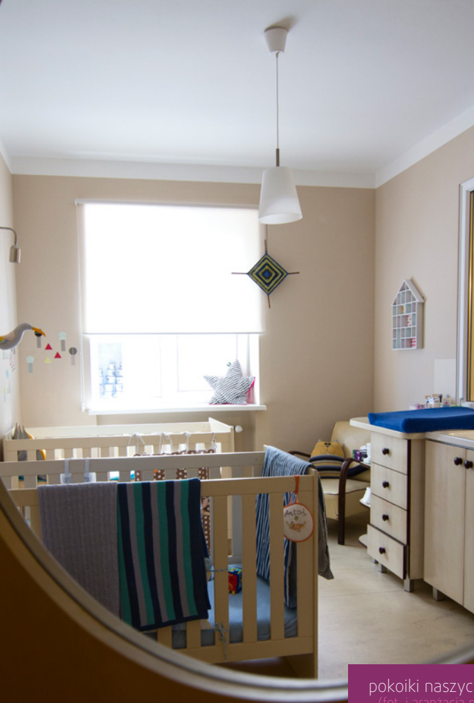
pokoiki naszych podopiecznych (fot. i aranżacja przestrzeni: Roomor)