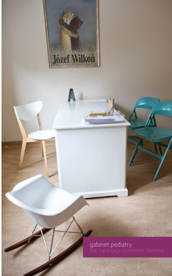
gabinet pediatry (fot. i aranżacja przestrzeni: Roomor)